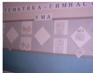
Математика - гимнастика ума!