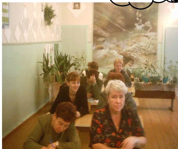
Наши педагоги на совещании - Что делать дальше?