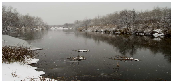
Наша речка Боровка не такая широкая, но утонуть в ней можно запросто. Помните о этом, когда катаетесь с гор!